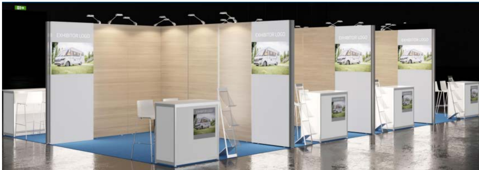
6,9,12m 2 ブースそれぞれの外観例